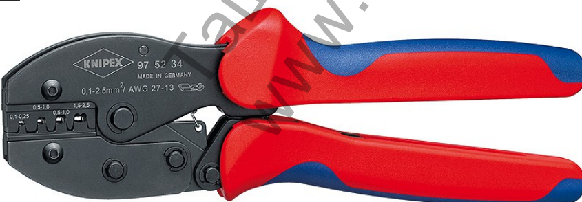
97 52 34 Клеци брѳнирани, двукомпонентни рѳкохватки, приспособленията за позициониране се предлагат като принадлежности