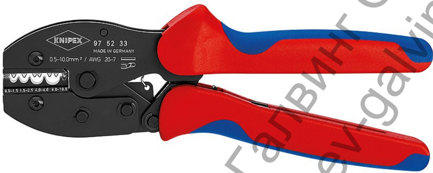
97 52 33 Клеци брѳнирани, двукомпонентни рѳкохватки