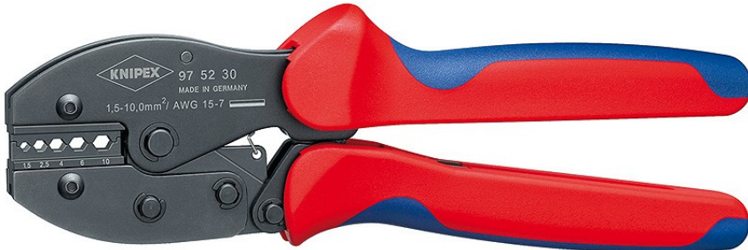
97 52 30 Клеци брѳнирани, двукомпонентни рѳкохватки